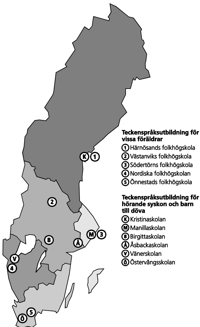
Figur 1. Utbildningsanordnarnas geografiska placering och den regionala indelningen

Teckenspråksutbildningarna för vissa föräldrar samt teckenspråksutbildningen för syskon och barn till döva bedrivs vid sammanlagt elva skolor i landet. Av dessa anordnas TUFF vid fem folkhögskolor medan teckenspråk för hörande syskon och barn till döva anordnas vid sex specialskolor.